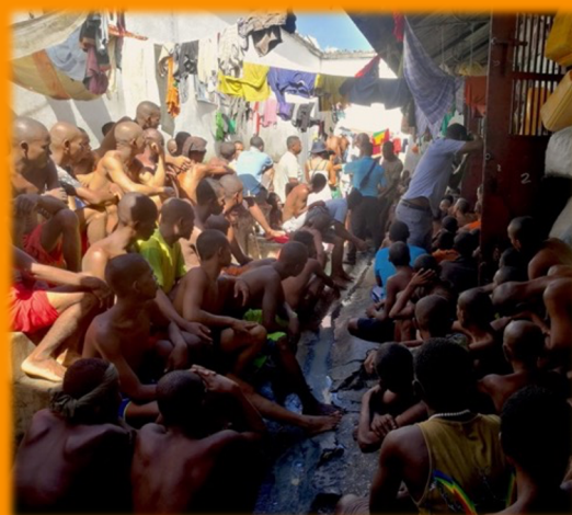
La surpopulation carcérale